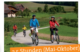
3,5 Stunden (Mai-Oktober)

zu allen Veranstaltungen der Tourist-Information Bernau.