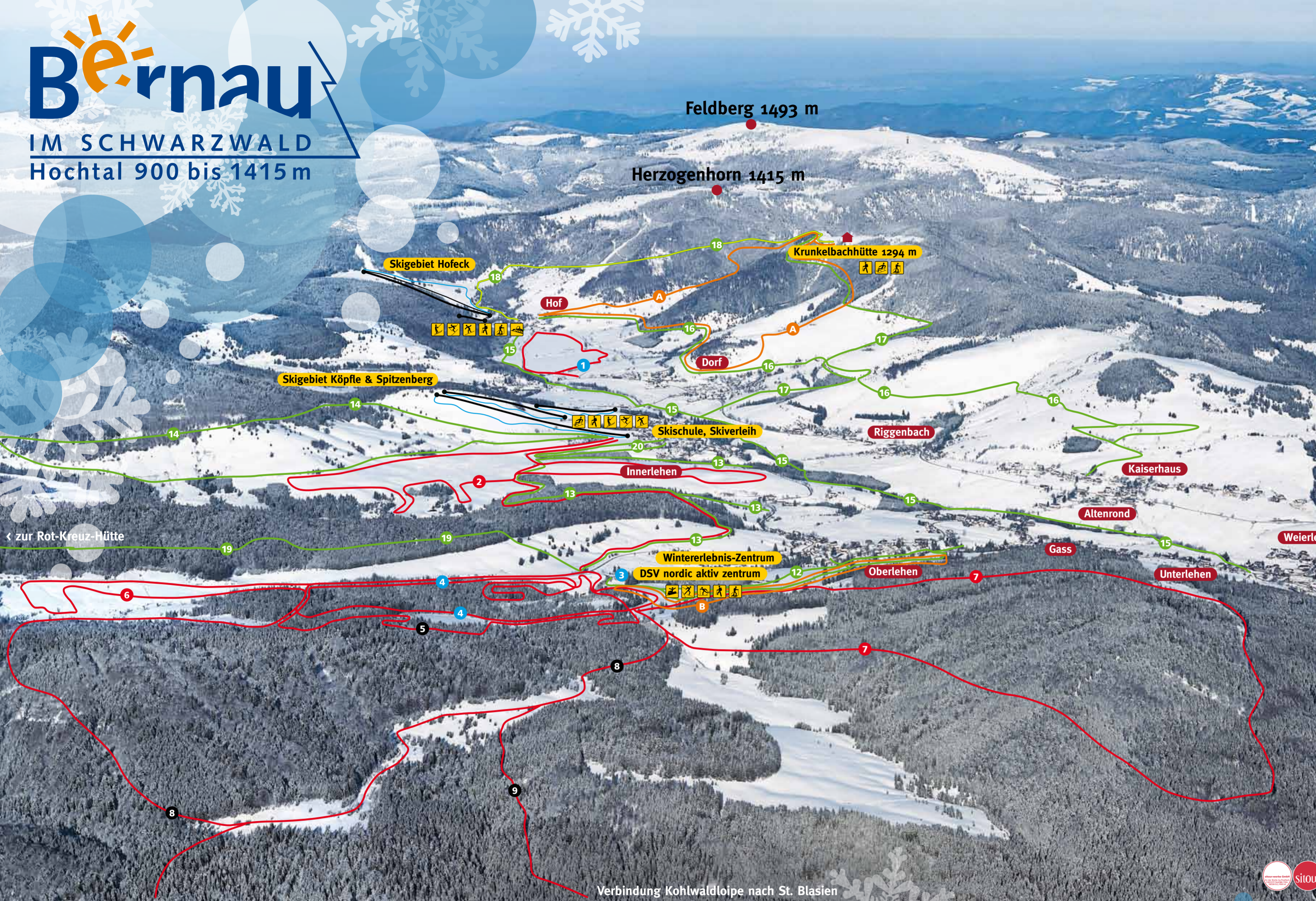
Verbindung Kohlwaldloipe nach St. Blasien