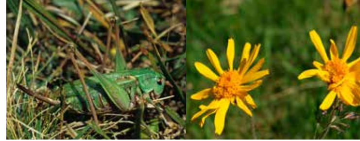
Lebensräume: Mensch und Natur im Zusam- menspiel haben eine Vielfalt an Lebensräumen entstehen lassen. Die artenreiche Arnika- wiese ist eine von diesen.

Schützenswert: Im Biosphärengebiet kommen zahlreiche Tier- und Pflanzenarten vor. Seltene Bewohner, wie z.B. den „Warzenbeisser“ gilt es besonders zu schützen.