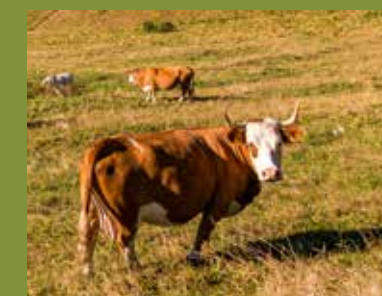
Hinterwälder: Klein aber oho! Hinterwälder sind kleiner als andere Rinderrassen und besonders robust und langlebig.