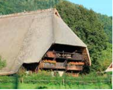
Schwarzwaldhof: Ein tiefgezogenes Dach schützt die Bewohner vor Wind und Wetter.

Schützenswert: Im Biosphärengebiet kommen zahlreiche Tier- und Pflanzenarten vor. Seltene Bewohner, wie z.B. den „Warzenbeisser“ gilt es besonders zu schützen.