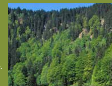
Buchen, Tannen und Fichten sind die Hauptbaumarten in den naturnahen Bergmischwäldern des Biosphärengebietes.

Das Biosphärengebiet Schwarzwald gehört zum Landschaftstyp der „grünlandreichen Waldlandschaften“. Der Wechsel zwischen Wald- und Offenland und der Weitblick von den höchsten Gipfeln kennzeichnen diese reizvolle Landschaft. Naturnahe Bergmischwälder der verschiedensten Höhenlagen und Expositionen sowie die Verzahnung der Lebensräume haben in Zusammenhang mit der menschlichen Nutzung zu außerordentlich artenreichen Lebensräumen für seltene Tiere und Pflanzen geführt. In den Kernzonen des Biosphärengebietes darf Natur Natur sein. Der Kernzonenwald wird auf 2100 ha (3,3 % der Gesamtfläche) sich selbst überlassen. In diesem „Urwald“ können Arten (über)leben, die auf die Zerfallsphase eines Waldes angewiesen sind.